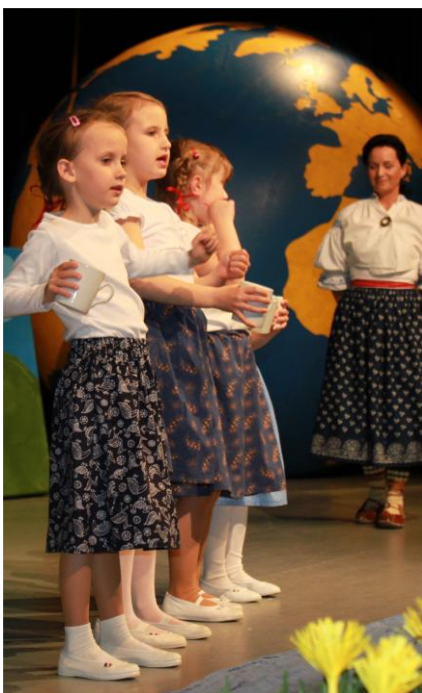
Folklórní sdružení VALÁŠEK